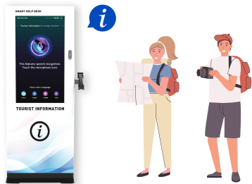
VKC (財) 韓国訪問委員会 VISIT KOREA COMMITTEE