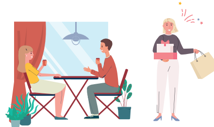
VKC (財) 韓国訪問委員会 VISIT KOREA COMMITTEE