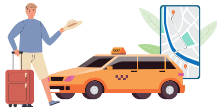
VKC (財) 韓国訪問委員会 VISIT KOREA COMMITTEE